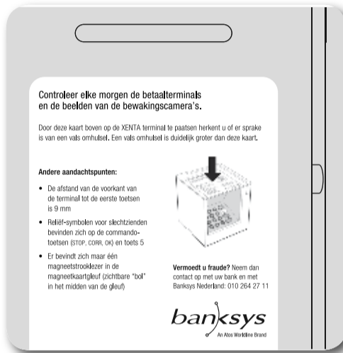
Banksys controleplaatje voor de XENTA

De afgelopen periode hebben zich gevallen van skimming aan betaalautomaten in winkels voorgedaan. Criminelen gebruiken hiervoor soms een overlay, waardoor de betaalautomaat net iets groter wordt. Zo ook bij de XENTA (afbeelding rechtsboven deze pagina). Hoewel de XENTA voldoet aan de laatste veiligheidseisen, is vastgesteld dat ook op deze betaalautomaat incidenteel is gefraudeerd. Om fraude middels een overlay op te kunnen merken heeft Banksys een controleplaatje ontwikkeld. Medio januari ontvingen bijna 11.000 ondernemers, die beschikken over een XENTA betaalautomaat, het plaatje.