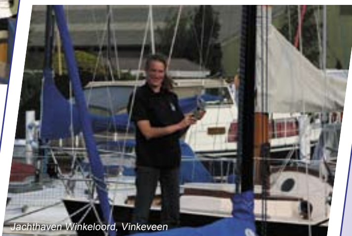
Jachthaven Winkeloord, Vinkeveen

Hoe minder contant geld, hoe veiliger. Daarom accepteren wij PIN. Er staat een PINterminal op onze horeca- en op onze sportafdeling. Binnenkort komt er een mobiele PINautomaat bij.