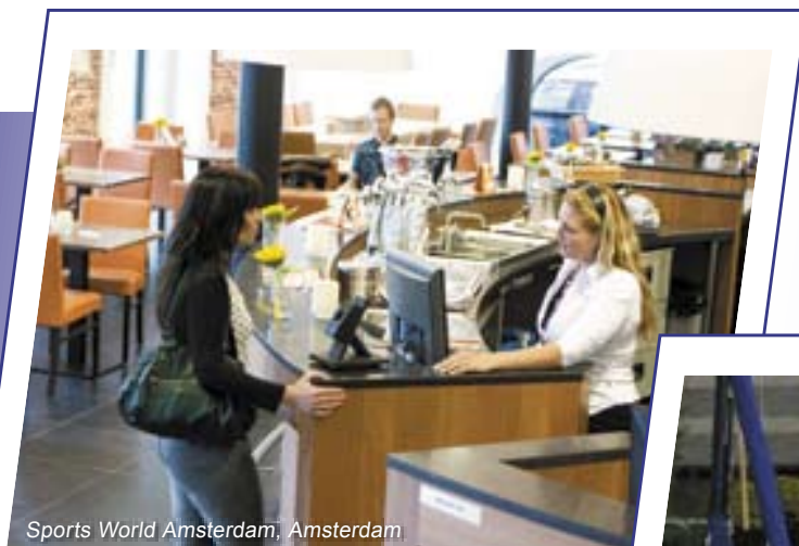
Sports World Amsterdam, Amsterdam

Hoe minder contant geld, hoe veiliger. Daarom accepteren wij PIN. Er staat een PINterminal op onze horeca- en op onze sportafdeling. Binnenkort komt er een mobiele PINautomaat bij.